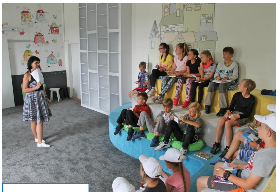
Vynovená detská izba VKMR

Pred časom sme priniesli správu o inovácii priestorov interiéru Verejnej knižnice M. Rešetku v Trenčíne, presnejšie detskej spoločenskej miestnosti nachádzajúcej sa v oddelení literatúra pre deti a mládež. Obnova sa realizovala prostredníctvom Fondu na podporu umenia, vďaka ktorému knižnica získala návrh dizajnového riešenia miestnosti, zabezpečila výmenu podlahovej krytiny a nové stoličky pre deti. V tomto roku pokračovala realizácia druhej fázy projektu pod názvom Detská spoločenská miestnosť II a Fond na podporu umenia ju z verejných zdrojov podporil vo výške 3 861 €. Priestory boli vybavené knižničnými regálmi vyrobenými na mieru, doplnené malými farebnými stolíkmi. Miestnosť od ostatných priestorov oddeľujú nové posuvné dvojkrídlové dvere. Podujatia pre menších i väčších návštevníkov sú často spopretrené premietaním prezentácií, a aby bol zaistený kvalitný obrazový efekt, nechýbalo ani zabezpečenie špeciálnych zatemňujúcich závesov a nástenného výsuvného plátna. ■ MET; Foto: VKMR