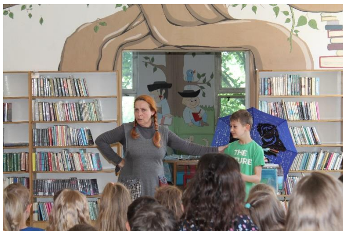
Interaktívne divadelné predstavenie Ja som Inna v podaní Teátra Neline