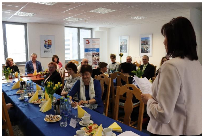
Týždeň slovenských knižníc: IX. stretnutie trenčianskych literátov